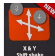
X & Y Shift shake